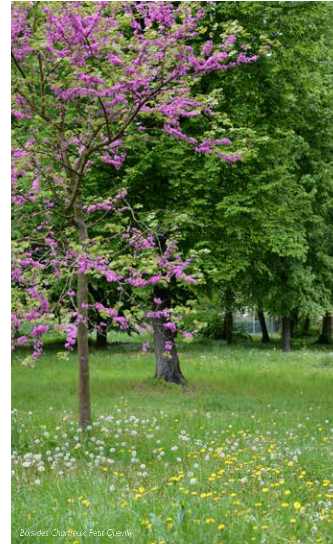
Bois des Chartreux, Petit-Quevilly