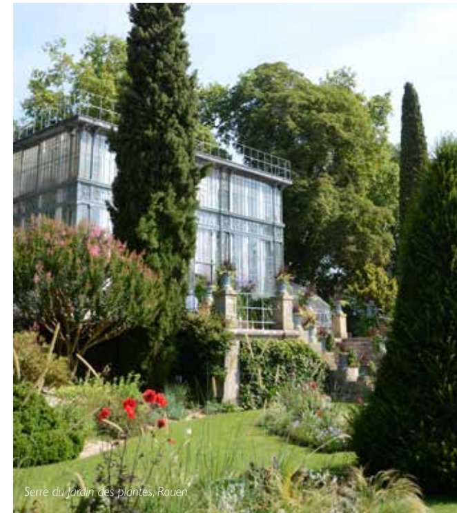
Serre du Jardin des plantes, Rouen