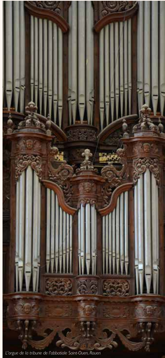
L'orgue de la tribune de l'abbatiale Saint-Ouen, Rouen