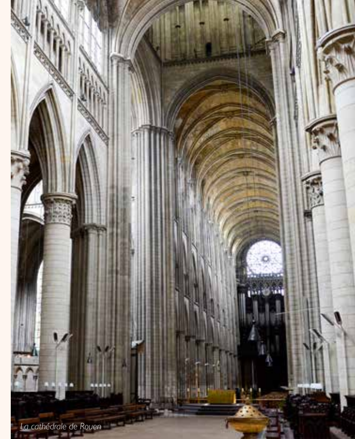
La cathédrale de Rouen

→ Devant la cathédrale de Rouen, place de la cathédrale Nombre de places limité, inscription obligatoire au 02 35 52 93 93 Gratuit