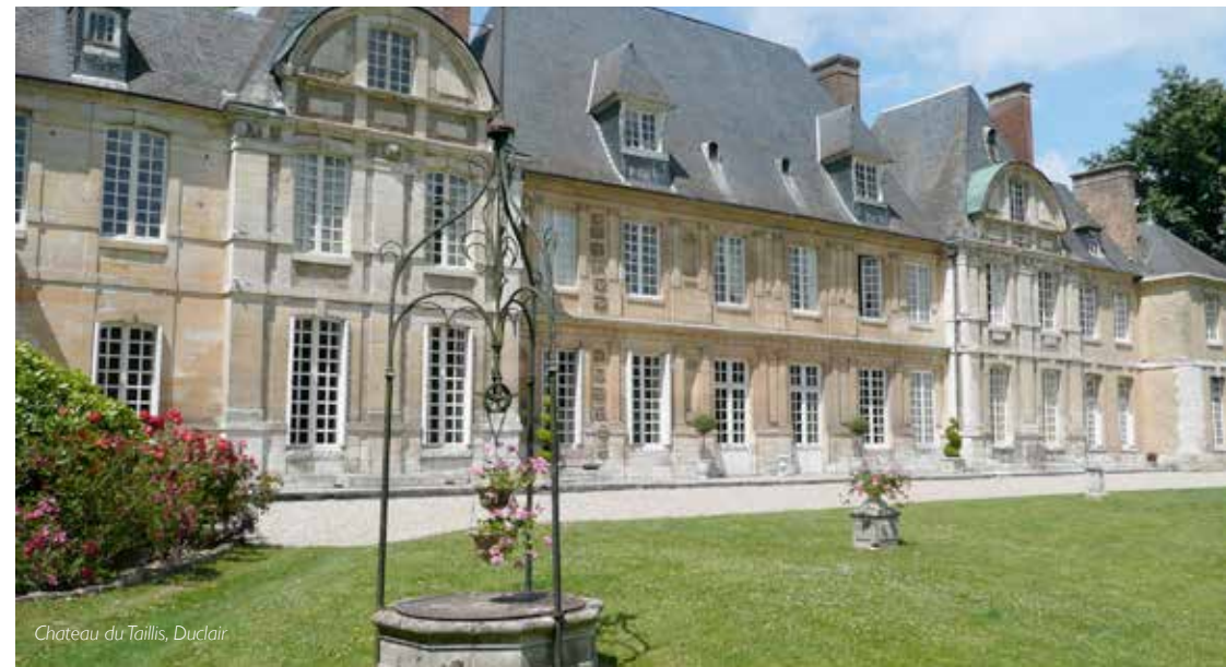
Chateau du Taillis, Duclair