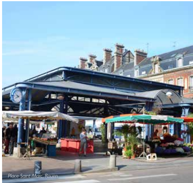
Place Saint-Marc, Rouen