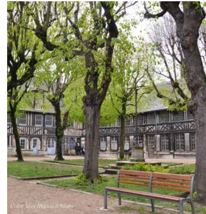
L'âtre Saint-Maclou, à Rouen

Droits d'entrée du Musée Pour plus de renseignements (notamment sur le cycle de conférences) : 02 35 03 54 95