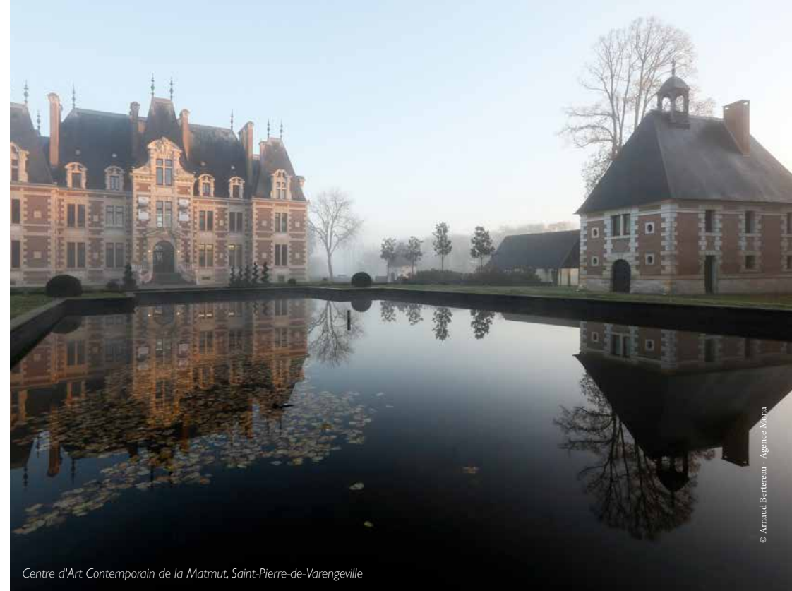
Centre d'Art Contemporain de la Matmut, Saint-Pierre-de-Varengville

Nombre de places limité. Plus d'informations et inscription en ligne du 1 er au 15 juin sur www.metropole-rouen-normandie.fr Gratuit