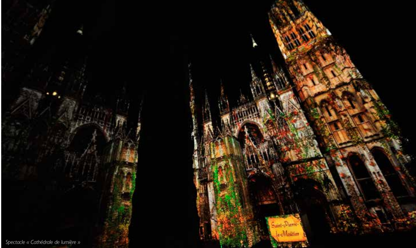
Spectacle « Cathédrale de lumière »