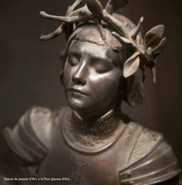
Statue de Jeanne d'Arc à la Tour Jeanne d'Arc.