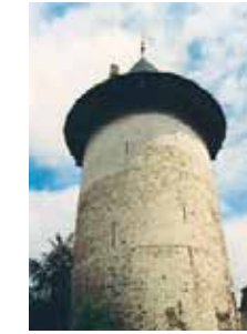
Le donjon du château de Philippe-Auguste.

Des vestiges de la tour de la Pucelle au pont Boieldieu, ce parcours retrace les derniers mois de la vie de Jeanne d'Arc. Cet itinéraire est aussi l'occasion de découvrir les lieux et les oeuvres d'art qui, dans la ville, rendent toujours hommage à Jeanne. Vous pourrez ainsi parcourir la salle du Musée des Beaux-Arts qui lui est dédiée, profiter de la place du Vieux marché ou encore visiter l'Historial.