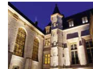
Historial Jeanne d'Arc

lui, été classé aux monuments historiques en 1909. La partie qui abrite l'Historial a été complètement restaurée depuis 2013. Sur près de 1000 m 2 , ce musée d'un nouveau genre retrace l'épopée de Jeanne à travers un parcours audio-visuel immersif. Il nous invite ensuite à mieux comprendre, dans un espace multimédia interactif, la construction de sa légende.