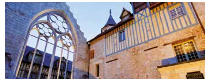
Cour intérieure de l'Historial Jeanne d'Arc.

Dès lors, Charles VII change de politique et laisse Jeanne tenter, seule, de reprendre Paris. Cette tentative se solde par un échec. Jeanne d'Arc poursuit cependant sa campagne. Elle se rend à Compiègne pour la délivrer des Anglais et des Bourguignons, mais elle y est faite prisonnière le 23 mai 1430. Elle est ensuite vendue aux Anglais et conduite à Rouen où se déroulera son procès. La ville, dans laquelle réside alors le duc de Bedford, est la capitale de la France anglaise depuis 1419.